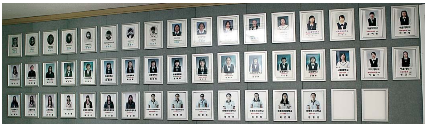
학교를 빛낸 영광의 얼굴