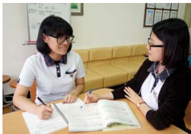
학습도우미 활동 모습