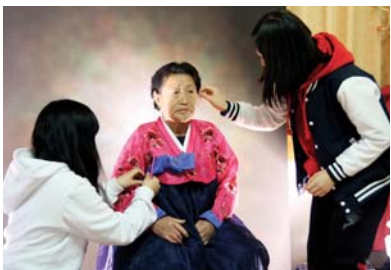
영정사진 촬영 모습