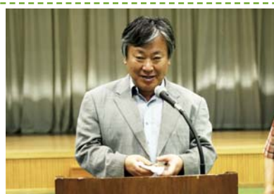
소설가 이문열 사백